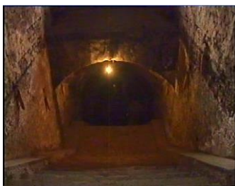
Închisoarea comunistă Jilava. Intrarea spre celulele subterane.

„Toate lucrurile lucrează împreună spre binele celor ce iubesc pe Dumnezeu”. (Romani 8:28) Aceasta este răsplata evlaviei.