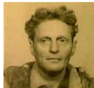
Fotografie a pastorului Richard Wurmbbrand în timpul detenției la Jilava