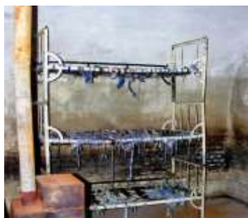
Celulă cu paturi suprapuse, fără saltele, pe care deținuții erau obligați să doarmă. Soba, doar de decor, niciodată încălzită în nopțile geroase de iarnă