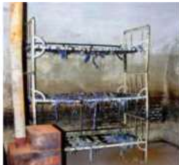
Celula cu paturi suprapuse, fără saltele, pe care deținuții erau obligați să doarmă. Soba, doar de decor, niciodată încălzită în iernile geroase