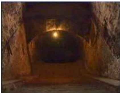
Închisoarea comunistă Jilava. Intrarea spre celulele subterane.

Creștinii continuă să arate iubire practică față de frații lor care sunt în nevoie. În atâtea cărți și mărturii, creștinii care au suferit descriu modul în care statornicia în credință a colegilor lor creștini le-a adus bucurie adevărată! Avem nevoie să învățăm de la ei că modul de a aduce adevărata bucurie este să urmăm exemplul lor de sacrificiu. Apostolul Pavel scrie: "Urmați-mă pe mine, fraților, și uitați-vă bine la cei ce se poartă după pilda pe care o aveți în noi. Căci v-am spus de multe ori, și vă mai spun și acum, plângând: sunt mulți care se poartă ca vrajmași ai crucii lui Hristos. Sfârșitul lor va fi pierzarea. Dumnezeul lor este pântecel, și slava lor este în rușinea lor, și se gândesc la lucrurile de pe pământ. Dar cetățenia noastră este în ceruri, de unde și așteptăm ca Mântuitor pe Domnul Isus Hristos." (Filipeni 3: 17-20)