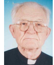
Preotul BOTA Ioan a scris:

Citiți mărturia sa în buletinul nostru online din 12/2015.