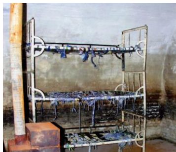
Celulă cu paturi suprapuse, fără saltele, pe care deținuții erau obligați să doarmă. Soba, doar de decor, niciodată încălzită în nopțile geroase de iarnă