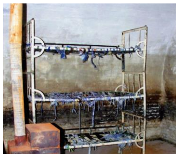
Celulă cu paturi suprapuse, fără saltele, pe care deținuții erau obligați să doarmă. Soba, doar de decor, niciodată încălzită în noaptea geroase de iarnă